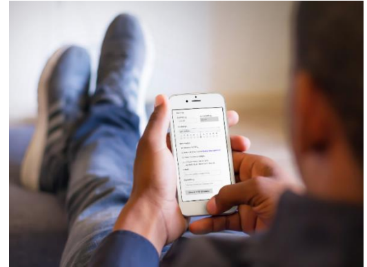
Figuur 6: Toezeggen via computer, tablet of mobiel