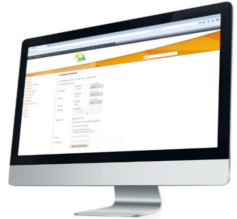
Figuur 3: Digitaal toezeggen

Het gemeentelid vult het formulier verder aan en klikt op 'Inzenden'.