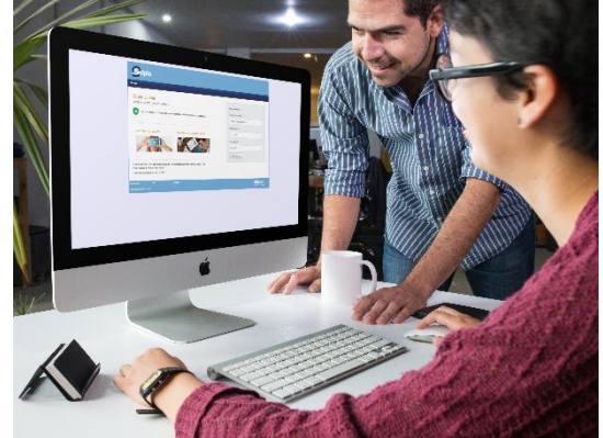
Figuur 5: Voordelen voor de kerk