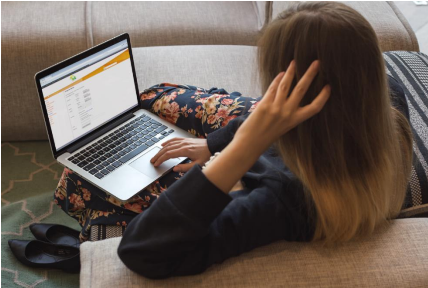
Figuur 7: Toezeggen binnen de vertrouwde omgeving van de eigen kerk

* Toelichting op de verschillende functionaliteiten vindt u in de bijlage van dit document. Alle bedragen zijn exclusief 21% BTW tenzij anders aangegeven. De website wordt ingericht conform de functionaliteiten, zoals beschreven in deze offerte. Aanvullend maatwerk is in overleg mogelijk. ** Exclusief de kosten en de implementatie van het SSL-certificaat, deze kunt u zelf regelen via uw hostingprovider.