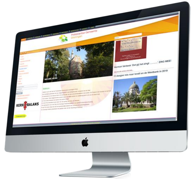
Figuur 1: Eenvoudig doorklikken naar het Kerkbalansformulier

* Uitnodigingsbrieven kunnen eenvoudig en snel vanuit Scipio (Online) – vanuit een selectie – per e-mail of per post worden verstuurd naar uw leden. Indien gewenst kan hier een (pdf) bijlage aan toegevoegd worden. U bepaalt zelf welke leden toegang hebben tot de toezeggingsmodule.